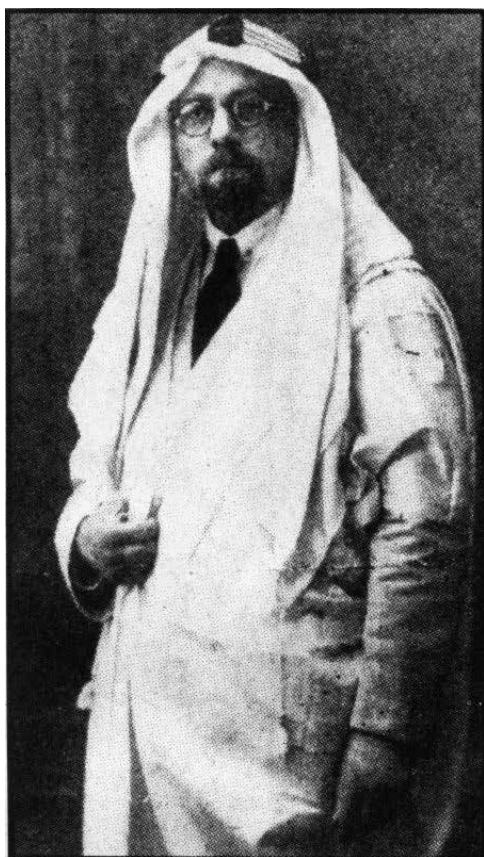
Jacob Israël de Haan in de Arabische kledij die hij droeg bij zijn bezoeken aan Transjordanië.

Haan, samen met de Hoge Commissaris. 52 En uiteindelijk volgde, overigens na veel strubbelingen, een dementi van de woorden die de kalief tegenover de journalist zou hebben uitgesproken. 53