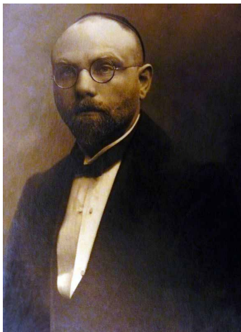
Jacob Israël de Haan in 1918

en tevens redacteur van de kinderkrant van het socialistische dagblad Het Volk . In 1904 publiceerde hij Pijpelijntjes , de eerste homo-erotische roman in de Nederlandse literatuur. Dit veroorzaakte een schandaal en leidde tot ontslag in beide functies. Hij ging rechten studeren en werd een veelgevraagd repetitor: De Haan was en bleef een begenadigd docent. Na zijn promotie en huwelijk met een niet-joodse vrouw leek zijn leven in rustig vaarwater te zijn beland. Maar rond 1915 raakte hij in een ernstige geloofscrisis, die leidde tot terugkeer tot het geloof van zijn jeugd en hem bovendien tot een vurig zionist maakte. Al eerder had hij naam gemaakt als dichter en nu ontwikkelde hij zich tot de zelfverklaarde 'Dichter van het Joodsche Lied'. Eind 1918 besloot hij naar Palestina te emigreren en werd hij aangesteld als correspondent van het Algemeen Handelsblad . In maart 1919 arriveerde De Haan in Jeruzalem, waar hij de rest van zijn leven op diverse adressen zou doorbrengen.