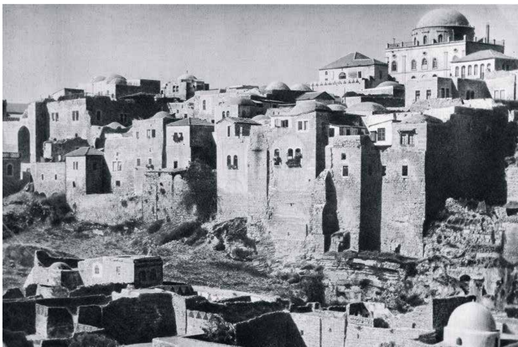
De joodse wijk in de oude stad van Jeruzalem c 1915.